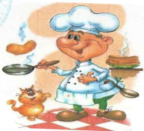
МЕНЮ «28» июня 2024 г.

Утверждаю Заведующий МБДОУ № 143 «Золотая рыбка» И.А.Агапова «27» июня 2024г.