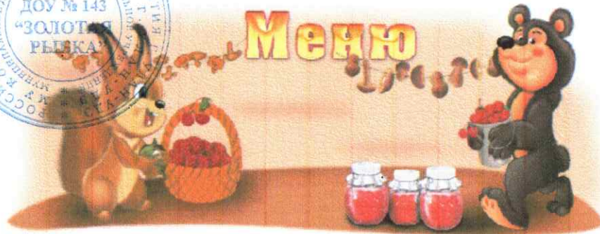
МЕНЮ «08» июля 2024 г.