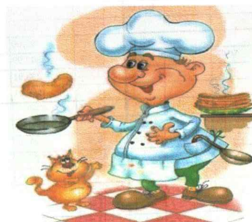
МЕНЮ «09» июля 2024 г.

Утверждаю Заведующий МБДОУ № 143 «Золотая рыбка» И.А.Агапова «08» июля 2024г.