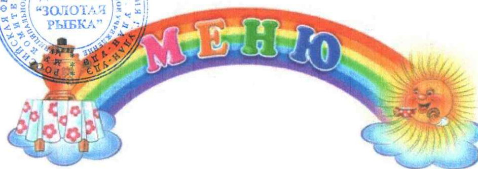
МЕНЮ «17» июля 2024 г.