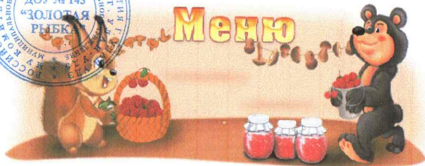
МЕНЮ «18» июля 2024 г.