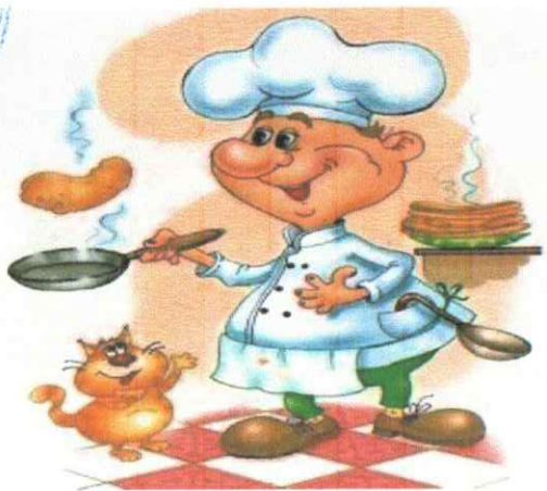
МЕНЮ «10» июля 2024 г.

Утверждаю Заведующий МБДОУ № 143 «Золотая рыбка» И.А.Агапова «09» июля 2024г.