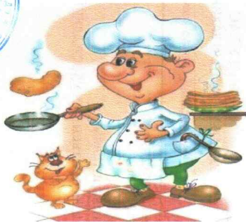
МЕНЮ «20» декабря 2023 г.